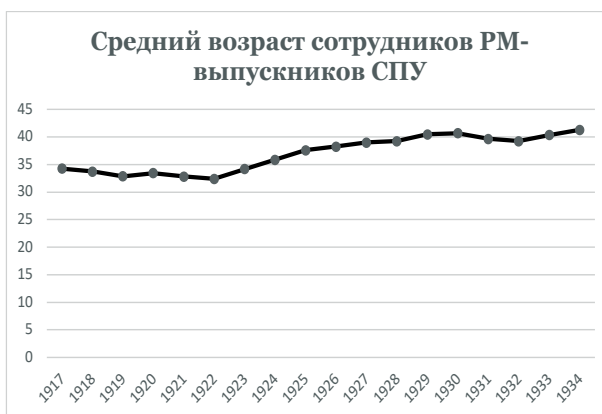
Рис. 3. Средний возраст сотрудников Русского музея в 1917–1934 годах – выпускников Санкт-Петербургского / Петроградского / Ленинградского университета

До 1919 года все выпускники университета, работавшие в Русском музее, были мужчинами (рис. 2). В 1920–1921 годах женщины занимали треть мест, после чего их доля стремительно снижалась, достигнув своего минимума (11,76 %) в 1924 году. В период с 1924 по 1930 год количество женщин-выпускников составляло не более 1/6 от общего числа, после чего увеличивалось вплоть до 1934 года, практически достигнув показателей 1920–1921 годов.