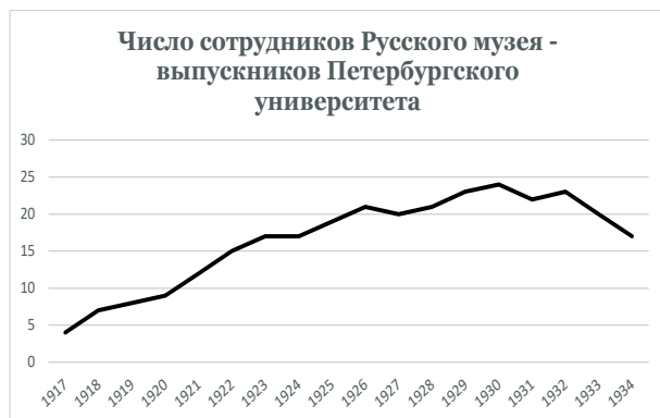
Рис. 1. Число сотрудников Русского музея в 1917–1934 годах – выпускников Санкт-Петербургского / Петроградского / Ленинградского университета

и «Историческая наука Петрограда-Ленинграда (1917–1934): центры, направления исследований, коллективная биография» 3 авторским коллективом были созданы базы данных «Преподавательский корпус Петроградского-Ленинградского университета, 1914–1934 гг.» и «Историки Петрограда-Ленинграда (1917–1934)». В эти базы данных вошло множество персоналий как сотрудников / преподавателей Петроградского / Ленинградского университета, работавших в нем в 1917–1934 годах, так и историков, проживающих в Петрограде / Ленинграде в указанный период. Благодаря созданным электронным словарям, а также продолжающемуся проекту, посвященному знаменитым выпускникам Санкт-Петербургского университета 4 , нам удалось получить следующие данные. Все упомянутые биографические словари размещены сейчас на сайте «Биографика СПбГУ» 5 .