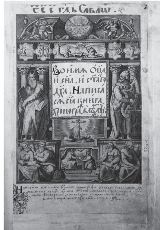
Рис. 2. Титульный лист с автографом Феодора Петрова.

Написана сия книга глаголемая Хронограф во граде Ярославле в рубленом граде, церкви святого Николая Чюдотворца священником Феодором Петровым, прозванием Рак, в лето по Рождестве Христове 1720» 4 .