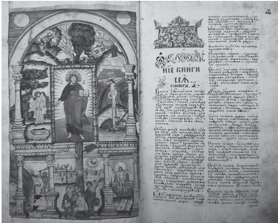
Рис. 4. Оглавление Хронографа («Оглавление книги сия»).