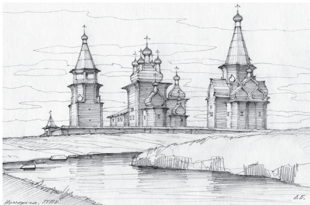
Рис. 1. Графическая реконструкция первоначального облика Преображенской церкви (1760), Благовещенской церкви (1764) и колокольни (1764) во второй половине XVIII века. Реконструкция А. Б. Бодэ

Figure 1. Graphic reconstruction of the original appearance of the Transfiguration Church (1760), the Annunciation Church (1764), and the bell tower (1764) in the second half of the XVIII century by A. B. Bode