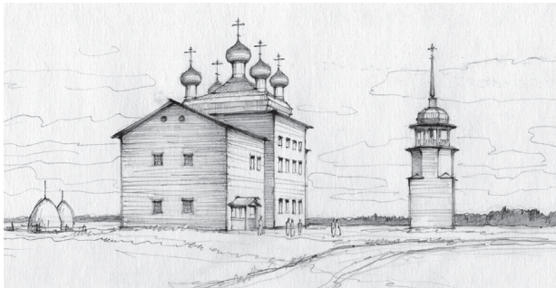
Рис. 2. Графическая реконструкция Преображенской церкви (1878), колокольни (1764) в начале XX века. Реконструкция А. Б. Бодэ