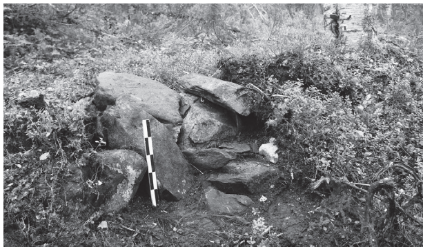
Рис. 3. Муезерский монастырь. Валунная «ограда». Вид с востока. 2019 год.

пристани к церкви, вторая – на деревню Авдеево на противоположном берегу озера. Существующий значительный незаполненный разрыв между «оградками» можно объяснить незаконченностью сооружения или возможным восполнением недостающих участков по периметру обители «облегченным» вариантом жердевой изгороди.