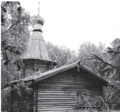
Рис. 1. Муезерский монастырь. Церковь свт. Николая Чудотворца. Вид с запада. 2019 год.

для молитвы, а вторая, квадратная – трапезную. Восточная часть алтаря и трапезная покрыты двускатными слеговыми кровлями. Над западной частью церкви возведен приземистый восьмерик, над ним – шатер с луковичной главкой [7: 179].