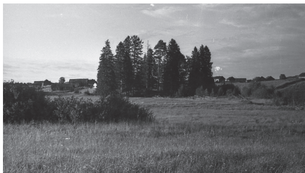
Рис. 1. Жальник с хвойными деревьями на песчаном холме около бывшей деревни Пелкаска (Püdkask), современный Вытегорский район Вологодской области. Место, трактуемое информантами как захоронение польских интервентов. 1963 год.

Данное свидетельство интересно в сопоставлении с приведенным в исследовании Н. А. Криничной упоминанием о былом «месте жительства панов, у которых был даже свой погост, то есть церковь со всеми ее принадлежностями» [11: 125]. В этом же исследовании приводится описание так называемого панского захоронения, важным элементом которого обозначается сакрализуемая сосна, что соответствует и вепским представлениям о так называемых почитаемых деревьях, в частности можжевельнике [3: 126]. Следовательно, дерево, роща с часовней или крест функционально тождественны при обозначении святости места, связанного с захоронением «панов» (градации в ту или другую сторону обусловлены превалированием языческих или христианских элементов в оформлении аналогичных по своей сущности объектов) [11: 120]. Священные рощи и отдельные почитаемые впоследствии деревья, зачастую находящиеся на возвышенностях, становились объектами, позволяющими локализовать древние захоронения [6: 26–29] (рис. 1).