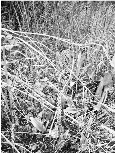
Рис. 1. Malaxis monophyllos на золоотвале НТГРЭС

Плотность особей M. monophyllos в лесном фитоценозе на золоотвале НТГРЭС высокая, она изменяется от 1 до 63 шт./0,25 м 2 (средняя плотность составила 8,2 шт./0,25 м 2 ) (рис. 1). Ценопопуляция с такой же высокой численностью и плотностью особей отмечена Т. И. Варлыгиной, М. Г. Вахрамеевой и др. на берегу прудов – накопителей шлам-лигнина Байкальского целлюлозно-бумажного комбината [2: 334].